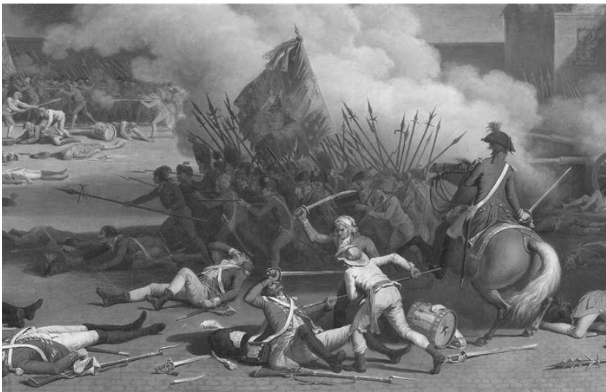
Assaut du palais des Tuileries défendu par la Garde suisse

Le 10 août 1792, la garde suisse du roi Louis XVI (950 hommes) fut massacrée presque jusqu'au dernier homme (600 morts, plus 200 qui moururent ensuite de leurs blessures ou sur la guillotine) en défendant le palais des Tuileries à Paris contre une foule de révolutionnaires qui l'avaient pris d'assaut. Le roi ne se trouvait déjà plus dans le palais, s'étant placé sous la protection de l'Assemblée nationale. L'événement est commémoré par un monument érigé à Lucerne représentant un lion blessé.